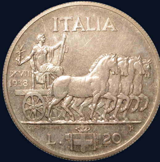
lotto 125 1050 110