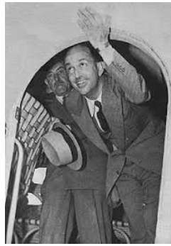
UMBERTO II di SAVOIA (1946)