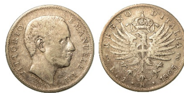
174 (in lotto)

173 Lotto "IMPERO" composto da 7 serie complete (da 2 lire, da 1 lira, da 50 e 20 centesimi) degli anni dal 1936 al 1943 più le serie complete da 10 e 5 centesimi degli anni 1937 e 1938 per un totale complessivo di 46 monete in conservazione da B a FDC 350