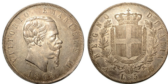
40 (in lotto)