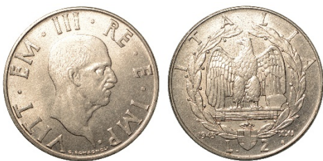
173 (in lotto)