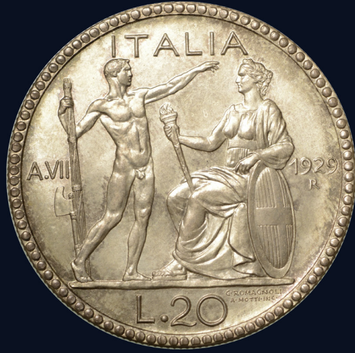
lotto 116 1050 110