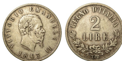
43 (in lotto)